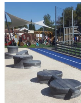
BASILE agrés type parkour équipement de zone de déplacements sportifs et sauts entre les différents éléments