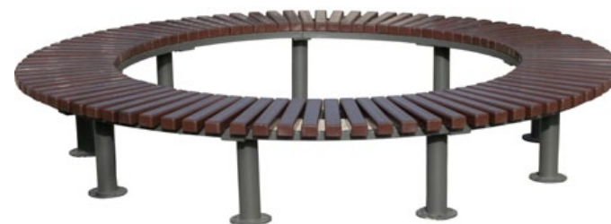
TELLUS assise tour arbre sur structure en acier thermo-laqué avec plusieurs diamètres proposés en standard.