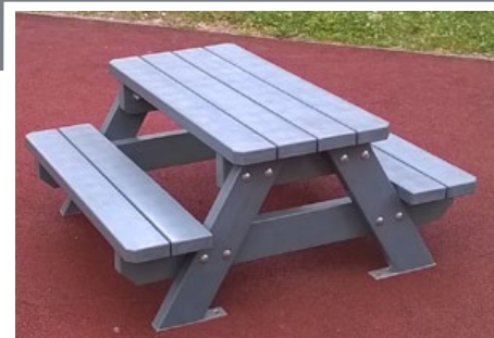
LOUNA table enfant table picnic, imputrescible, existe en plusieurs tailles pour les enfants, mais également en taille adulte pour les ados.