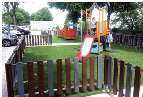
DANA barrière jeux avec structure inox, sans entretien, couleur des lattes au choix.