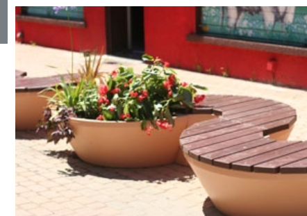
NAYA module banquette permet de présenter une solution de banquette ou d'entourage d'arbre, avec module jardinière coordonné