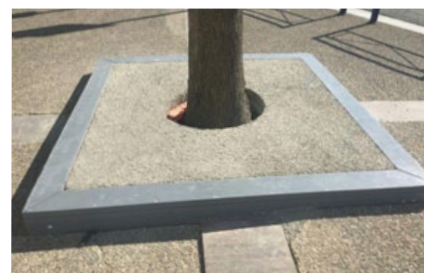
JARRET platelage arbre cadre résistant aux chocs rempli avec un agrégat organique ou minéral drainant. Panel de couleurs disponible.