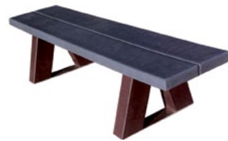
TOUPTI banquette maternelle différentes hauteurs sont proposées en standard selon catégories d'âges.

Enfin, grâce à ce type d'achat éco-responsable, la collectivité montre son engagement dans l'économie circulaire et le développement durable.