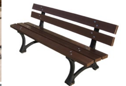
MURANO banc adulte en composite plastique recyclé & fonte, sans angle vif et sans entretien.