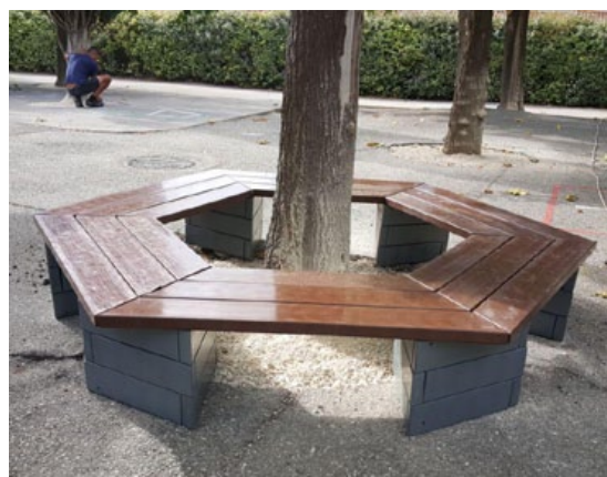
AMAGO module hexa tour d'arbre hexagonal avec possibilité de participation pédagogique à la conception, l'implantation voire la fabrication et la pose ...