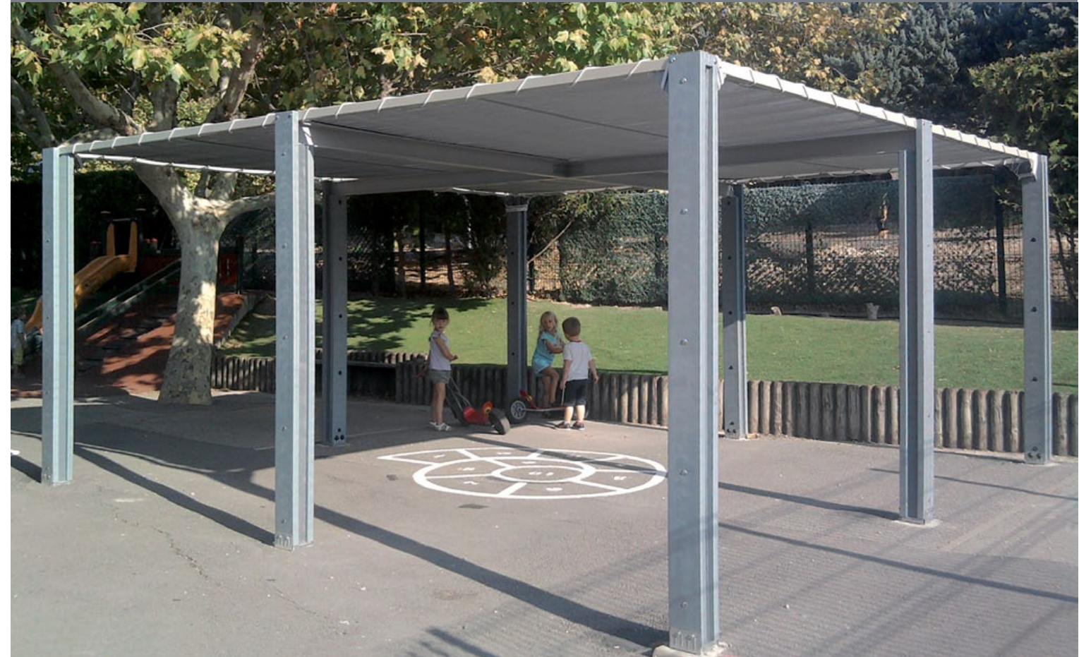
MINOS ombrière de cour d'école