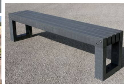
CAMBYSE banquette adulte durable, issue du travail d'un éco-designer et composé à 100% de plastique composite recyclé.