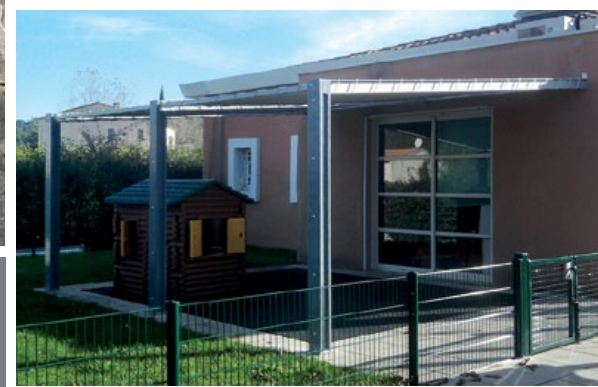
MINOS ombrière façade en composite plastique recyclé et PRV, sans entretien ni risque d'écharde, avec bâche occultante de couleur.