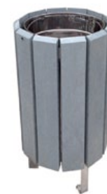
SERPIO corbeille légère avec possibilité de couvercle réducteur ou occultant total.