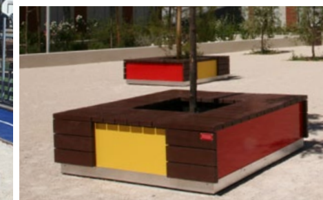
DALOS module assise tour d'arbre sans dossier coloris des panneaux au choix