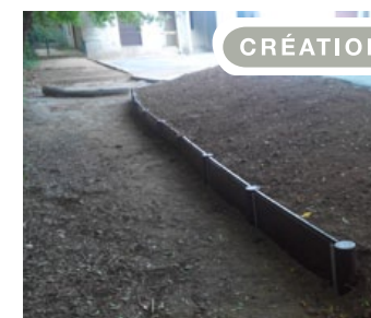
BORDURE de talus pour marquer proprement les limites des zones de terre en sur-élévation.