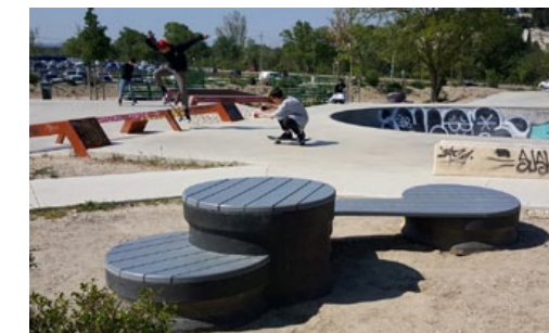
BASILE assise banc ados gamme de module d'assise ultra résistante