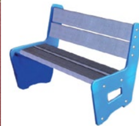
SOFA banc maternelle pour les crèches et les maternelles avec couleurs vives pour les flasques latérales.