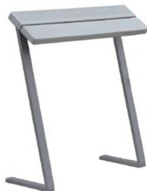
SERPIO banc assis-debout design pour les zones attentes de parents ou de repos léger dans les cours.