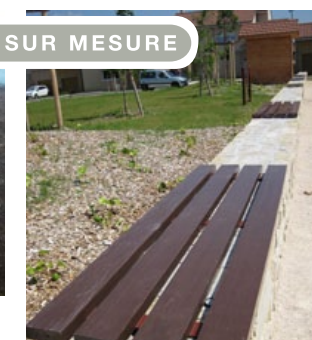
NASTA assise sur muret pour la protection et l'utilisation en assise des murets en béton.