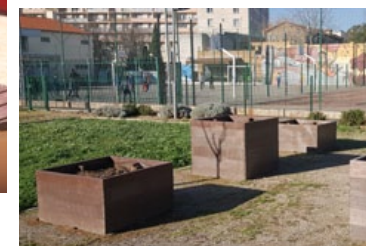
TOLEA T1 potager pédagogique pour amener et maîtriser le jardin dans la cour de l'école.